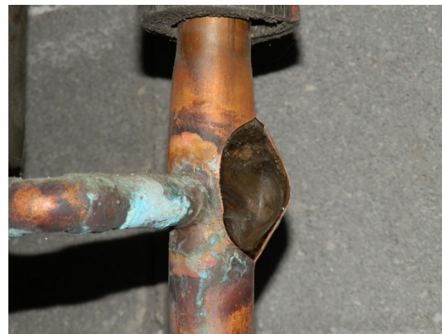
Tuyau déchiré suite au gel

5- La vidange est terminée : refermez tous les robinets de vos installations sanitaires